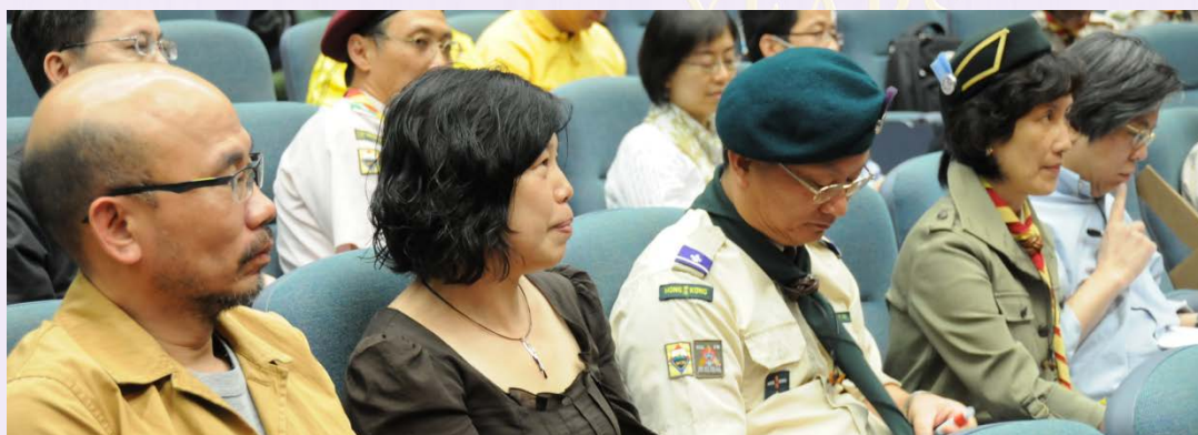
區旅校合作是一家 (2011)