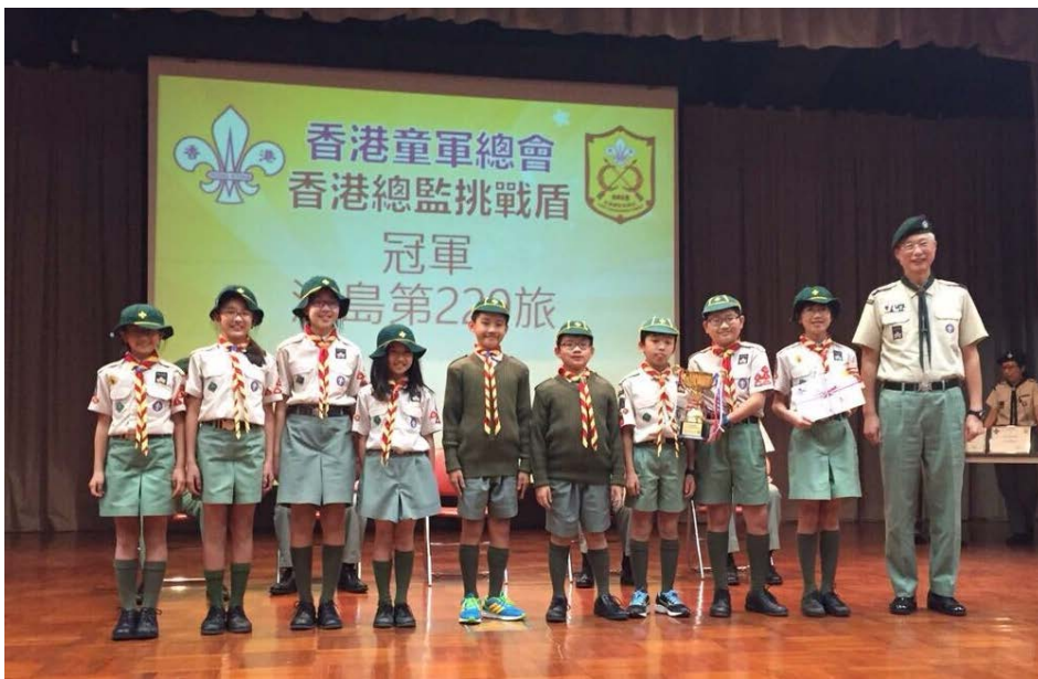
香港總監挑戰盾港島第229旅—冠軍 (2015)