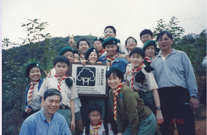
229 旅的第一個五年，在寶馬山上豎立紀念牌 (1990)