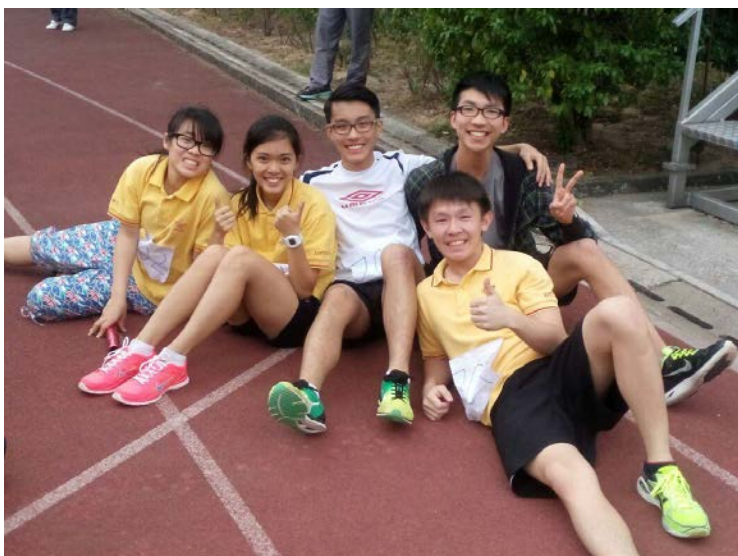
新知舊雨在陸運會 (2015)