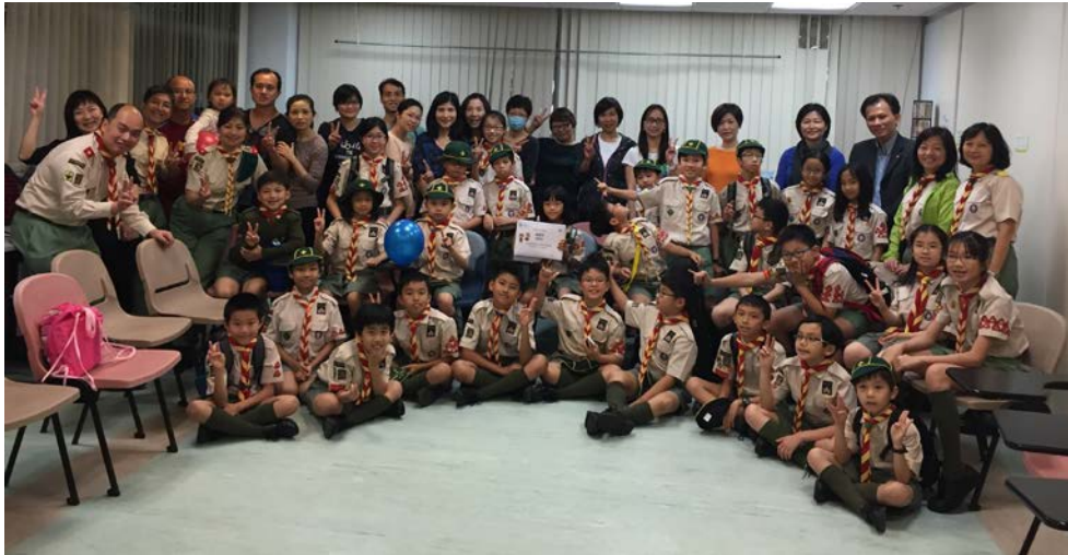
229 旅做服務都聲勢浩大 (2015)