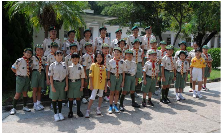
當年領袖幼童軍入營比例為1比3！(2011)