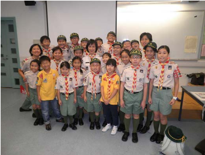
孫旅長講森林故事，粉絲無數！(2011)