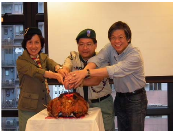
5年前的5月22日, Benny Sir 重出229江湖! (2011)