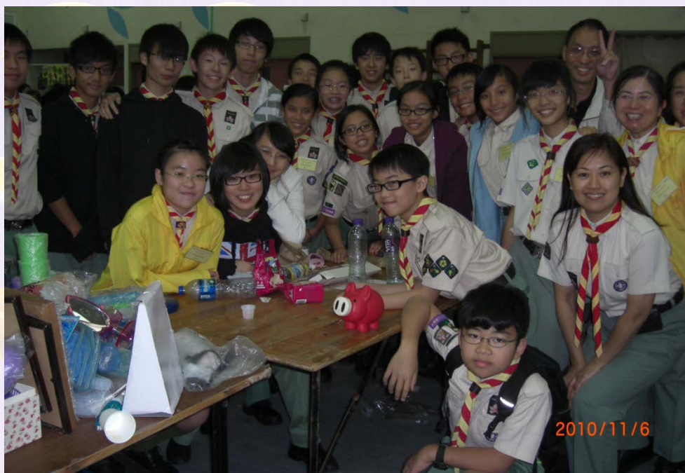
為兒童骨科醫院籌款 (2010)