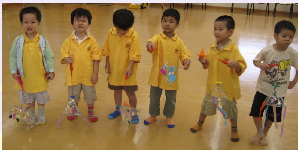
我們的明日之星--幼兒童軍 (2010)