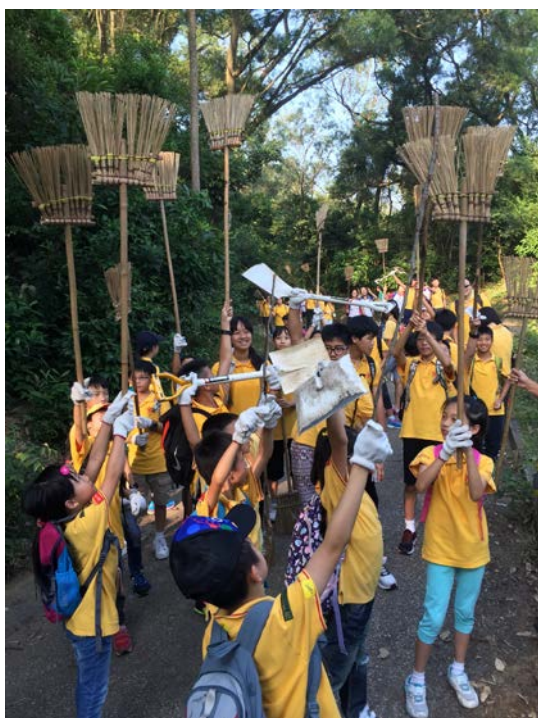
郊野公園掃樹葉，黃色掃把運動， 唯一受全城歡迎的有顏色運動， 不論藍營、綠營、黃營，全都歡迎！ (2015)