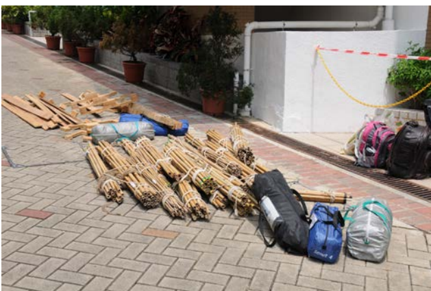
入營 Gear 大曬棚！(2011)