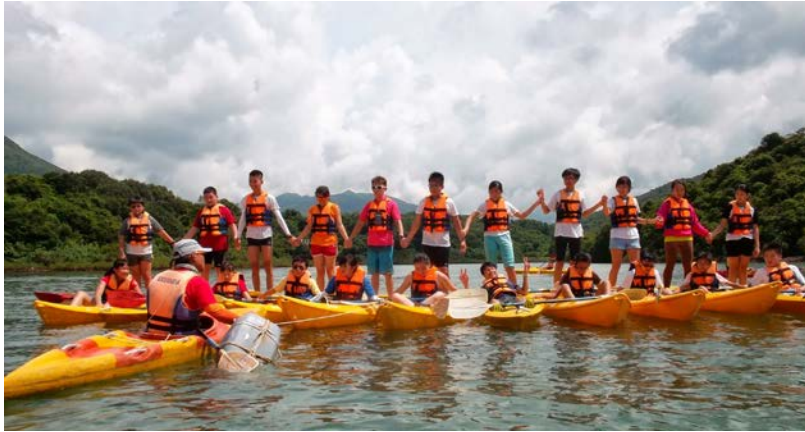
暑假大露營！型、型、型！（2014）