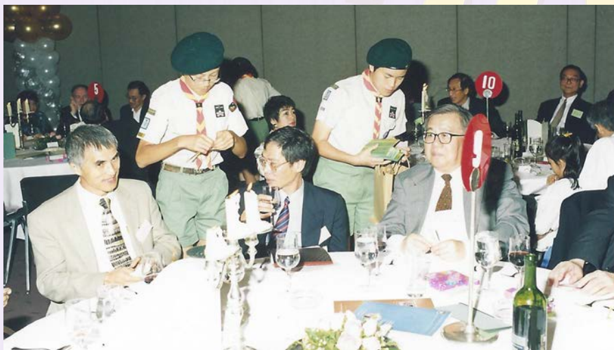
「服務他人，造福社會」 童軍團在香港大學同學聚餐上協助銷售獎券 (1996)