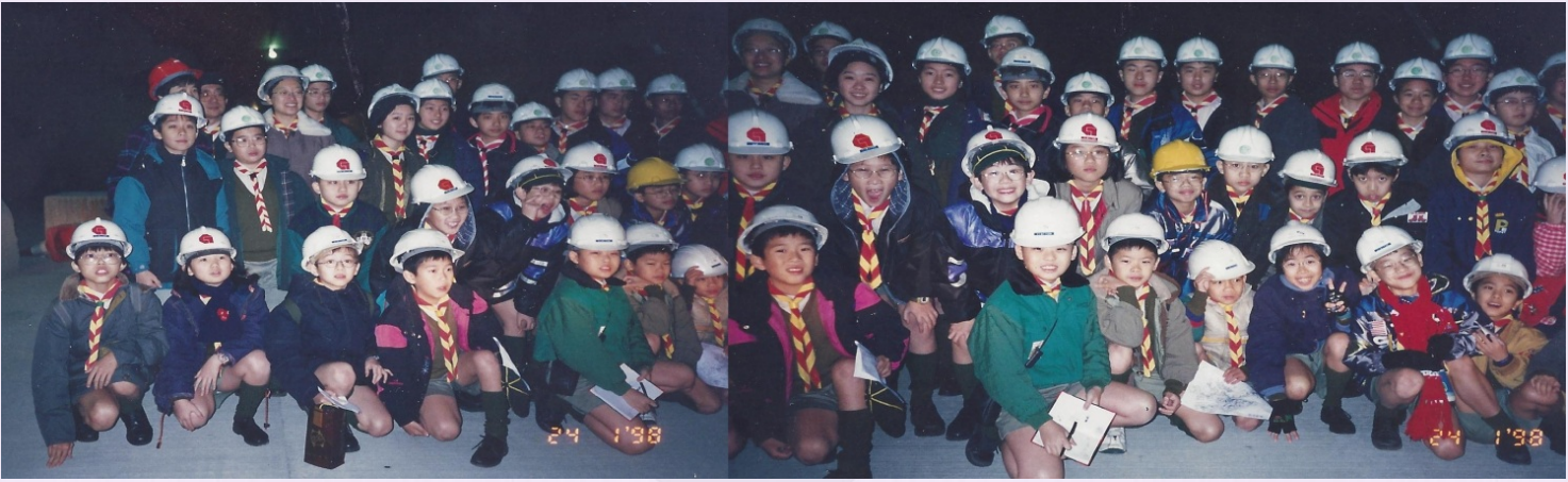
裝備自己，走在別人之前。三號幹線啓用前 229 旅先行視察 (1997)