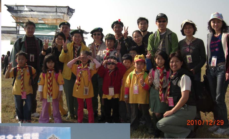
香港童軍 100 周年紀念大露營 (2010)