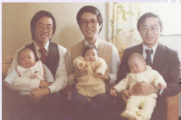
229 旅就從這 3 小福萌生 (198?)