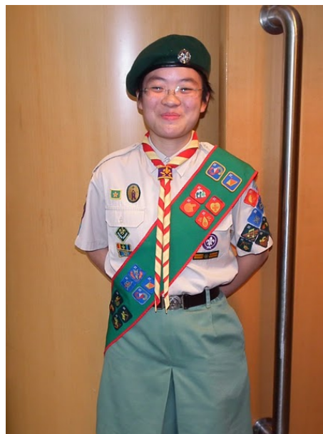
這樣陽光燦爛的笑容! (2011)