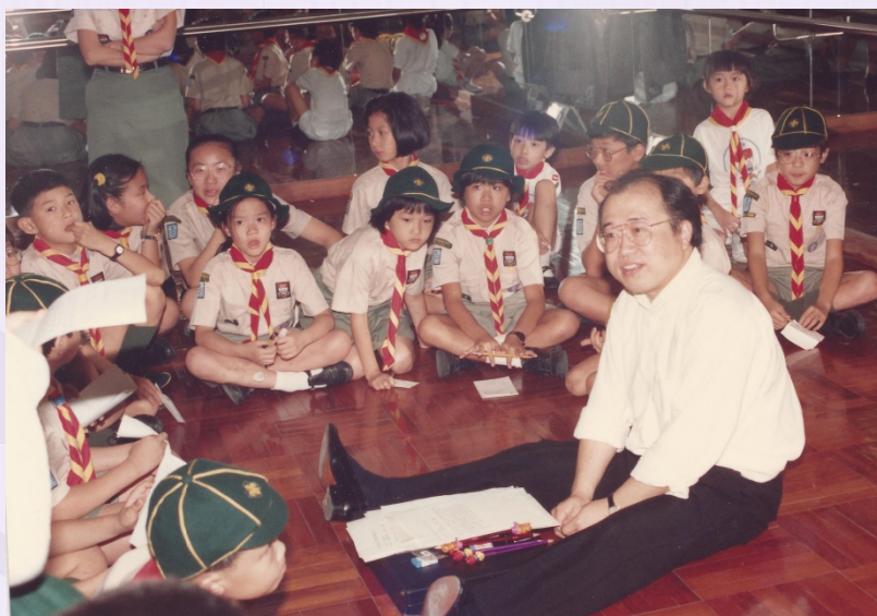
西貢戶外康樂營 滾軸溜冰小精靈 (1989)