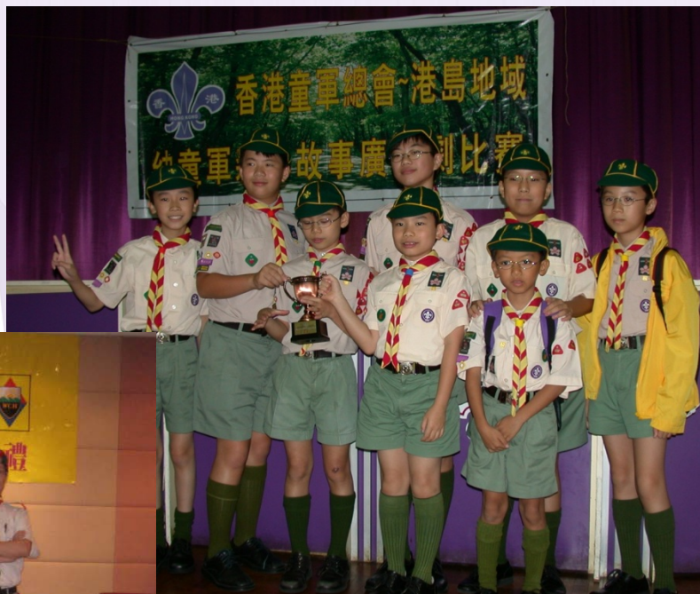
幼童軍森林故事廣播劇比賽 (2004)