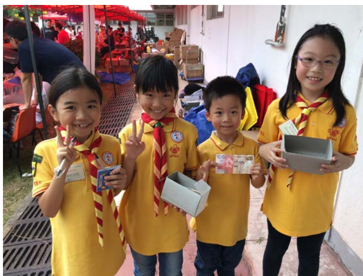
大口環義賣日，小童軍說：請幫我買枝筆！ 路人甲問：為什麼我要幫妳買這枝筆？ 小童軍答道：因為這枝筆能寫盡天下字！！ (2015)