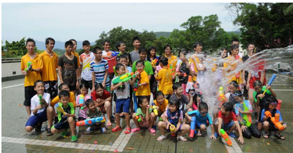
暑期親子大露營，向大伙兒潑水！只有一個人有這樣的膽量！（2012）