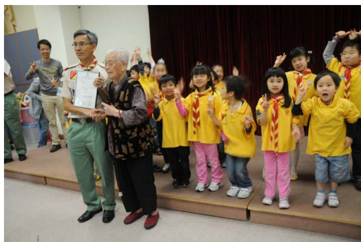
能為 90 古來稀的婆婆服務, 是我們的福氣! (2011)