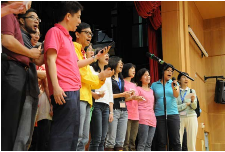
旅慶家長們高歌一曲 (2013)