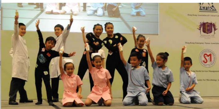
參加世界衛生組織一個全球「拯救生命：清潔雙手」行動計劃，以原創舞蹈形式表達，並於第五屆國際控制感染學術會議開幕禮上首演（2012）