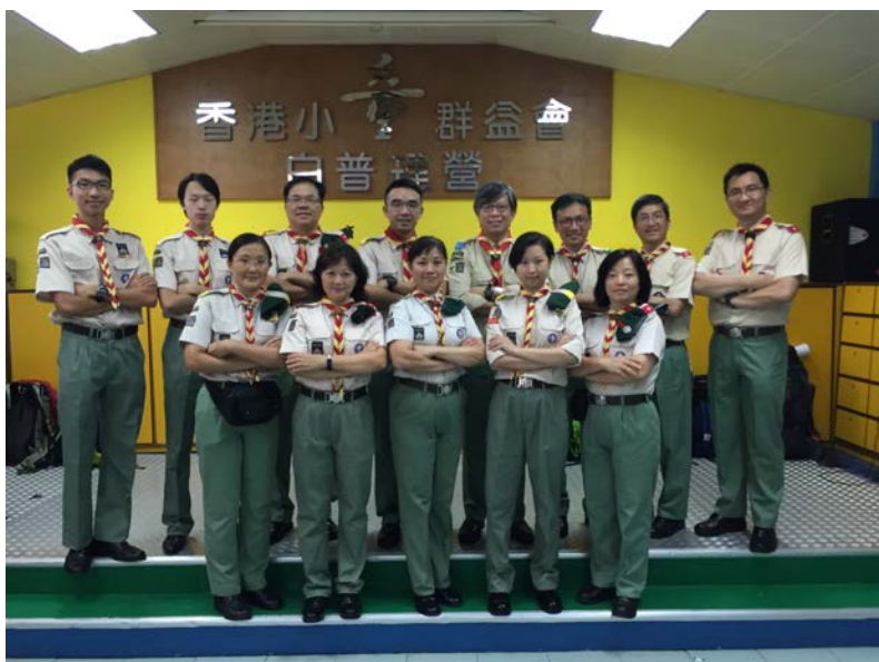
昨天的童軍、家長，今日的領袖 (2015)