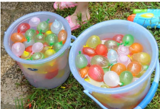
親子夏令營重頭戲--水戰！(2011)