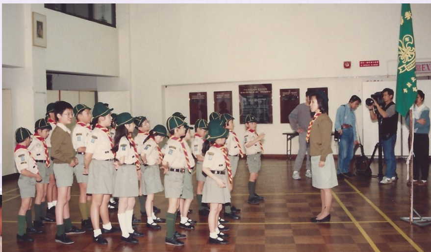
無線電台星期一檔案採訪 229 旅 童軍集會情況 (199?)