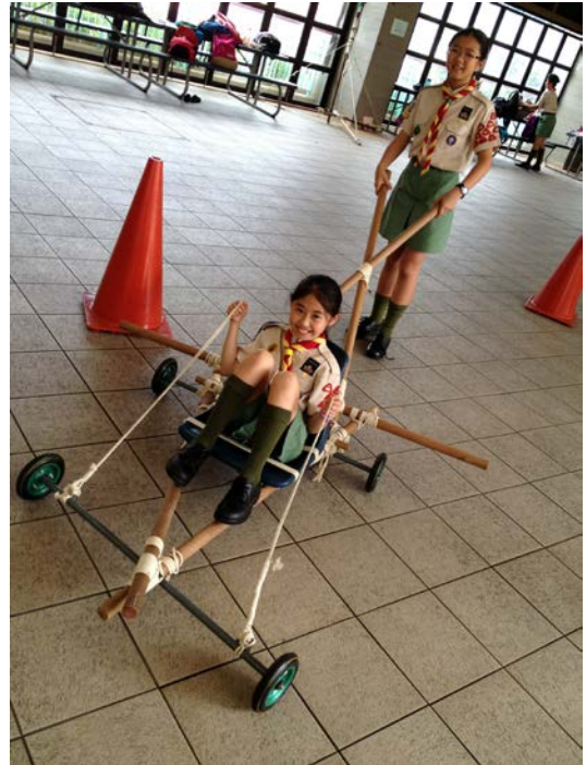
先鋒工程是可以這樣紮作的--賽車! (2013)