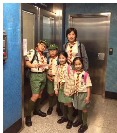
社區探訪－維城1903，從社區探訪去到警署，原因只得一個：路不拾遺（2012）