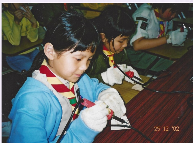
吓！女孩子做金工？巾幗不讓鬚眉！！ (2002)