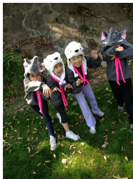
服務、服務、再服務，讓兒童看見彩虹！(2014)