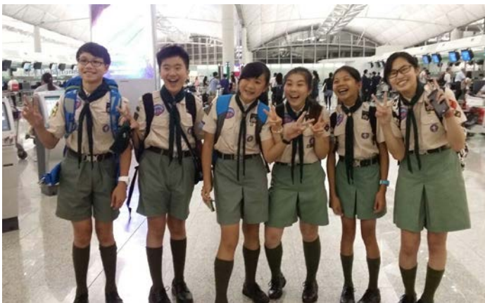
忙碌的一年，去完蘇格蘭大露營，再去韓國大露營（2014）