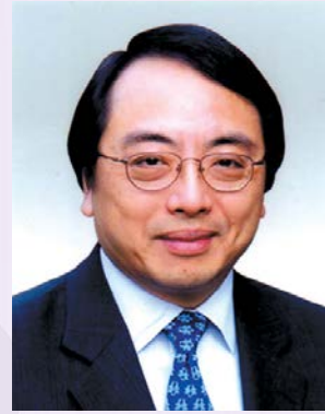
Professor Lap-Chee Tsui